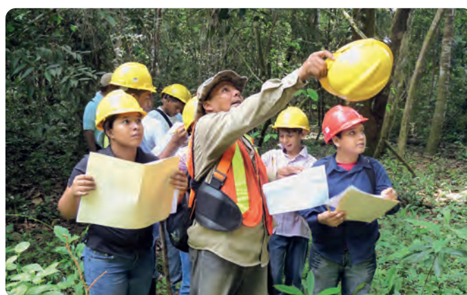
Umweltbildungsprojekte, wie ein Waldlehrpfad für Schulen der Region, flankieren das Projekt.